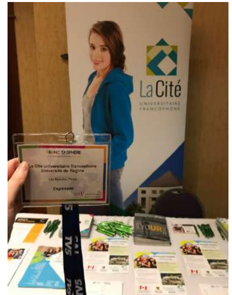
Table de présentation de La Cité au FrancoSphère de l'ACELF