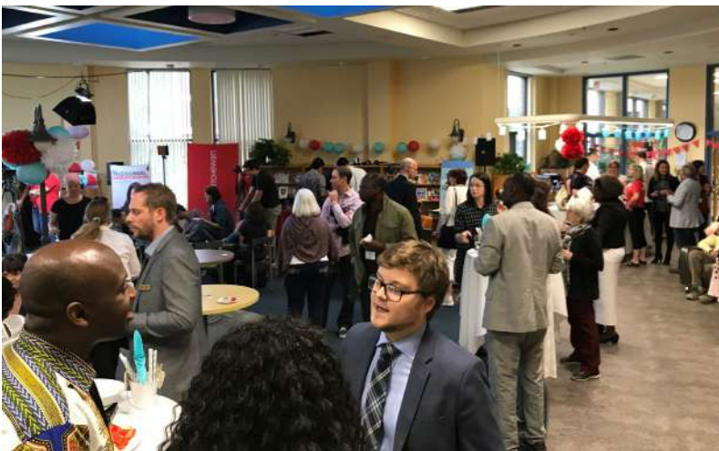
5 à 7 de la rentrée de septembre 2017 en partenariat avec Ici Radio-Canada Saskatchewan