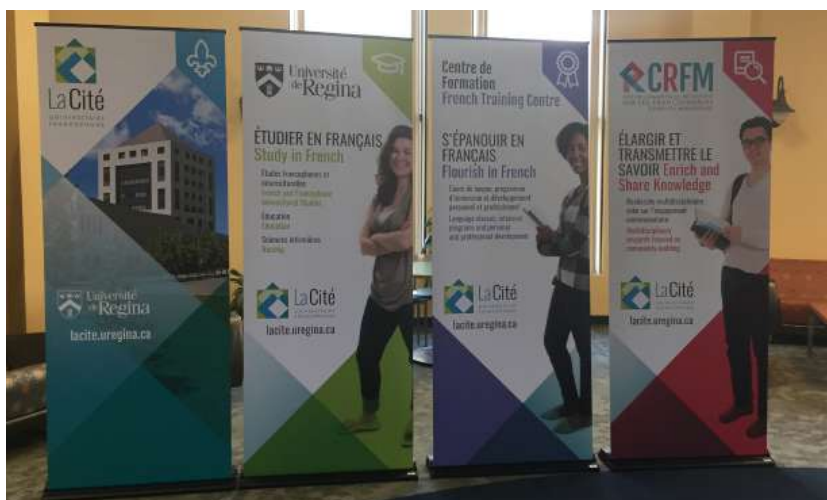
Quatre nouvelles bannières promotionnelles pour la promotion conjointe ou individuelle des secteurs de La Cité

Une quinzaine de publicités ont été placées dans les médias sur le web ou dans les versions papier de CPF Magazine, Explore Regina, Leader Post, Star Phoenix, l'Eau vive, le portail de l'Association des collèges et universités de la francophonie canadienne (ACUFC) ou encore le Centre for Continuing Education (CCE) de l'Université de Regina. Ces publicités faisaient la promotion des programmes académiques et de formation continue de La Cité, en anglais, en français ou de façon bilingue en fonction du public visé.