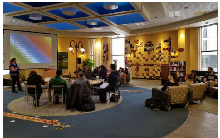
Atelier sur le Fléché fransaskois animé par la Société historique de la Saskatchewan