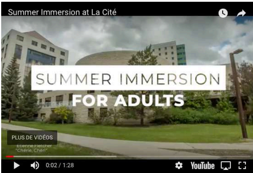
Vidéo promotionnelle réalisée pour le programme d'immersion d'été pour adultes du Centre de formation