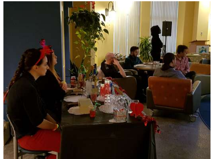
Rendez-vous for Two, soirée à thème pour un 5 à 7 festif