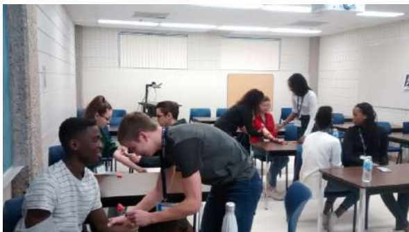
Des étudiants lors de la Journée des carrières en santé 2018