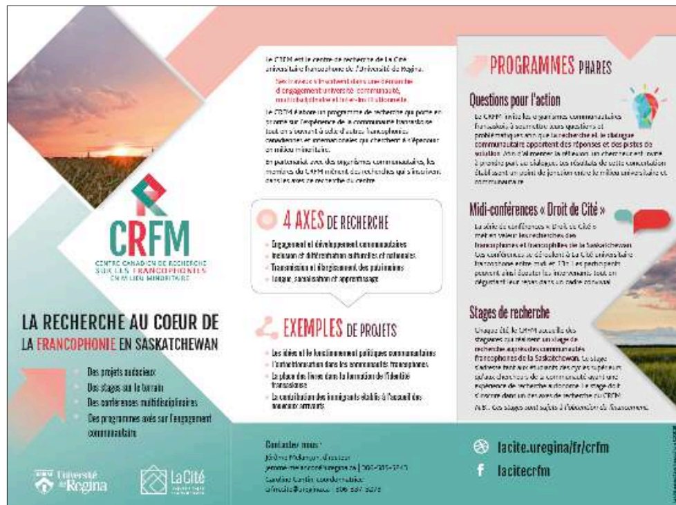
Dépliant promotionnel bilingue