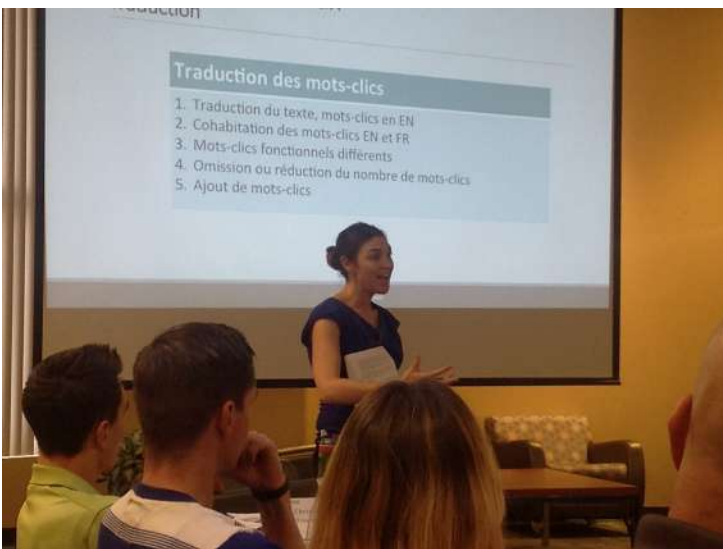
Programme de développement professionnel sur le thème de la traduction et rédaction web; une formation proposée par le groupe Postrophe.