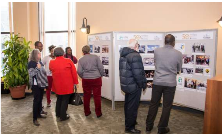
Exposition de photographies extraites du livre Contre toute attente