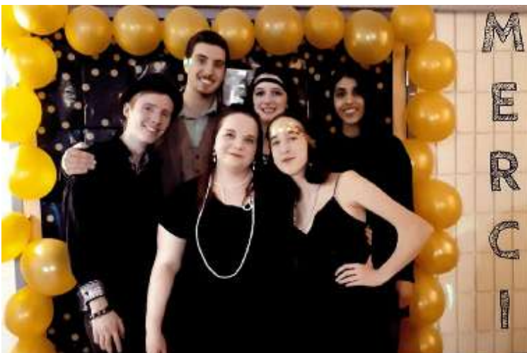
L'équipe des Leaders de La Cité 2017-18 lors de leurs activités étudiantes